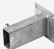
Fourreau à platine à 4 lumières