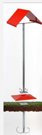
Balise Aérienne en 2 parties