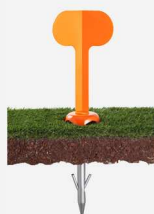
Repère de parcelle