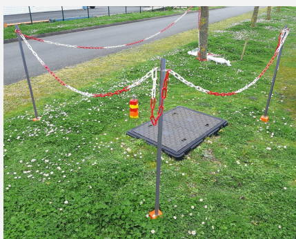
Piquet porte filet Piquet d'emprise provisoire