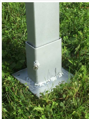
mât de signalisation 80 x 40