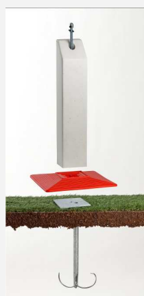
Borne résine à embase carrée et à pan coupé (700 mm)