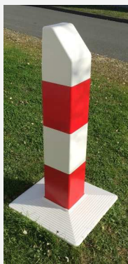
Borne emboîtable à pan coupé