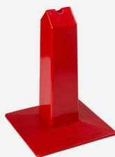
Borne plastique à 2 pans