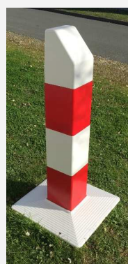
Borne plastique à modules emboîtables et à pan coupé (200 à 1000 mm)