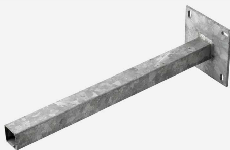
Mât à platine à 4 lumières (disponible en différentes tailles voir p.98)