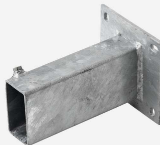
Fourreau à platine à 4 lumières (disponible en différentes tailles voir p.91)