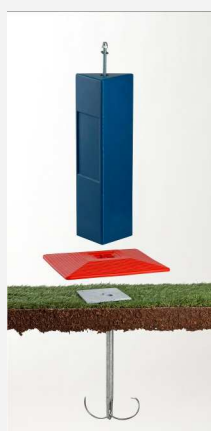
Borne résine triangulaire TP (200, 500 et 700 mm)